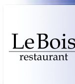
レストラン【ル・ボワ】