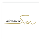
カフェレストラン【スワン】