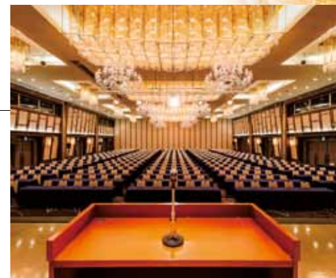
孔雀の間(宴会場として)

県内最大級のグレートホール「孔雀の間」をはじめ、様々な会場をご用意いたしております。結婚披露宴から全国大会、国際会議など目的や人数にあわせてご利用いただけます。個室もご用意いたしております。少人数の会議や宴会など幅広くご利用いただけます。