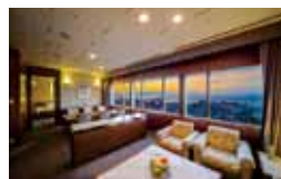
デラックススイートルーム