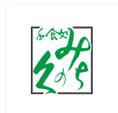
和食処【みちのくに】