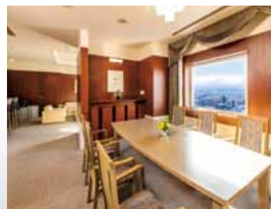
ロイヤルスイートルーム