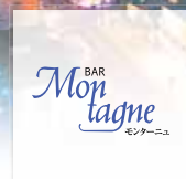
スカイバー【モンターニュ】