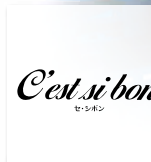
プライベートルーム【セ・シボン】