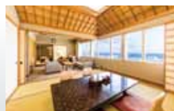
和室スイートルーム